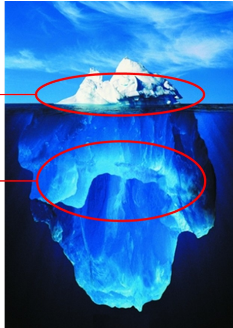
De ABC-Methode inzichten voor doelgroepenbeleid

A ttitude, affiniteiten, B alans, emotionele stabiliteit C ompetenties gedrags- indicatoren